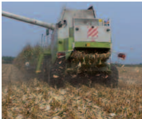
Raccolta di mais con trinciastocchi integrato.