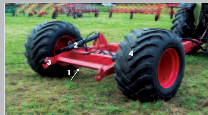
CARRELLO PORTA ATTREZZI SERIE LD