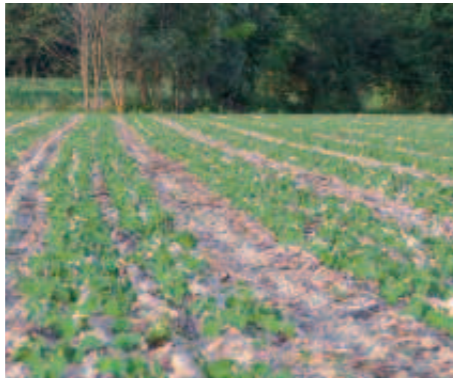
Soia in emergenza sullo stesso appezzamento.