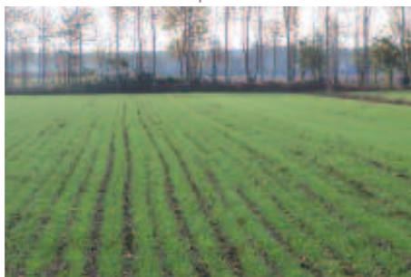
Emergenza di cereale autunno-vernino.

Una corretta gestione della raccolta della coltura precedente è la base per il successo di qualsiasi tipo di semina: