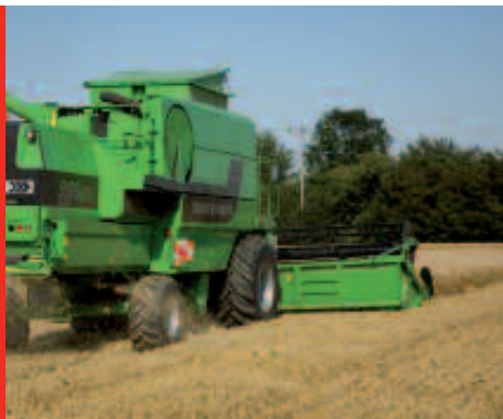
Raccolta di cereali a paglia - spargipula e trinciapaglia.