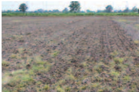
Terreno dopo il passaggio con il coltivatore sottosuperficie.