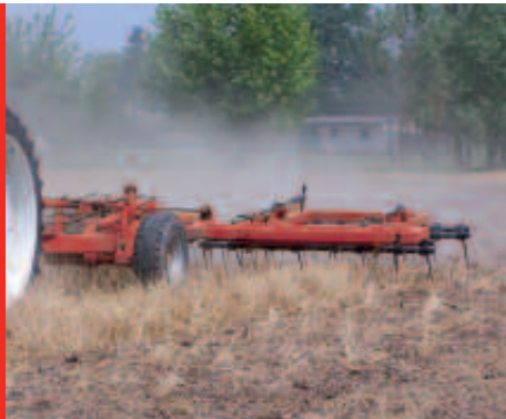
Straw Harrow su intercalare devitalizzata.